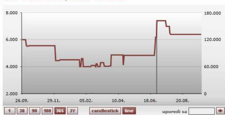
LKDN - Luka Dunav a.d., Pančevo - 25.09.2014.

– grafički prikazi dnevnih oscilacija cene i obima prometa u prethodna tri meseca, pre objavljivanja obaveštenja o nameri preuzimanja, pri čemu "x" osa označava datum, a "y" osa označava cenu, odnosno obim prometa;