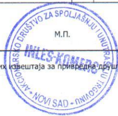
Образац прописан Правилником о садржини и форми обрзаца финансијских извештаја за привредне друштва, задруге и предузетнике ("Службени гласник РС", бр. 95/2014 и 144/2014)